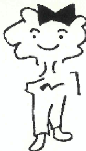
DIBUJOS: Natalia Torres.

Dale Spender, Elisabeth Sarah i altres: Learning to lose : Sexism and Education. Women's Press. London 1986